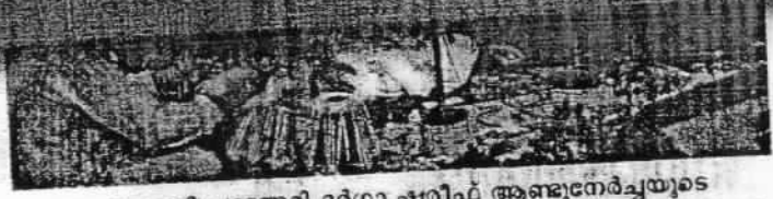
പുത്തനത്താണി ചാനേരി ദർഗാ ഷരീഫ് ആണ്ടുനേർച്ചയുടെ ഭാഗമായി ഖവാലി മെഹ്ഫിൽ അവതരിപ്പിക്കുന്നു.

സമൂഹ സിയാറത്ത്, ഖവാലി മെഹ്ഫിൽ, മൗലീദ് പാരായണം, അന്നദാനം എന്നിവയുണ്ടായി. ഒട്ടേറെ വിശ്വാസികൾ നേർച്ചയിൽ പങ്കാളികളായി.